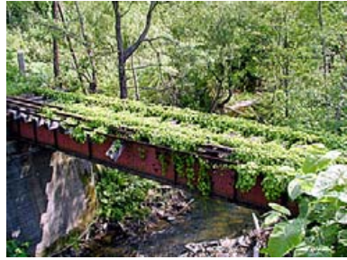
▲エコ鉄橋（選炭機への専用線）