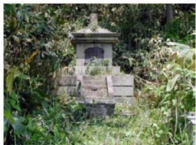
▲会社が建立した慰霊碑