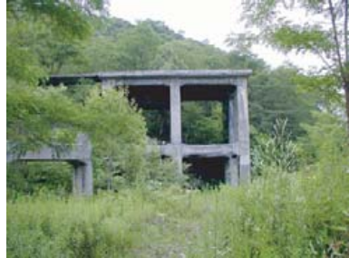
▲斜坑巻モーターの台座