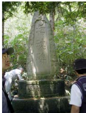
▲坑夫総代が建立した招魂碑