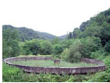
▲シクナー（微粉炭の沈殿装置）