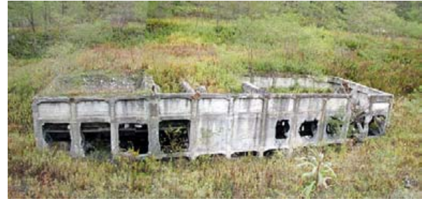
▲原炭ポケット（石炭の一時貯蔵装置）