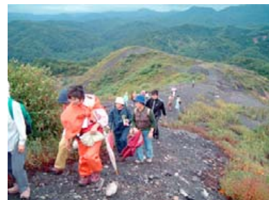
●P ズリ山（石炭を選別した後に出る岩石を積み上げた人工の山）