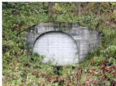
▲音羽坑（最も古い坑口）